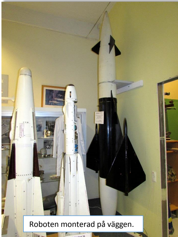
Roboten monterad på väggen.