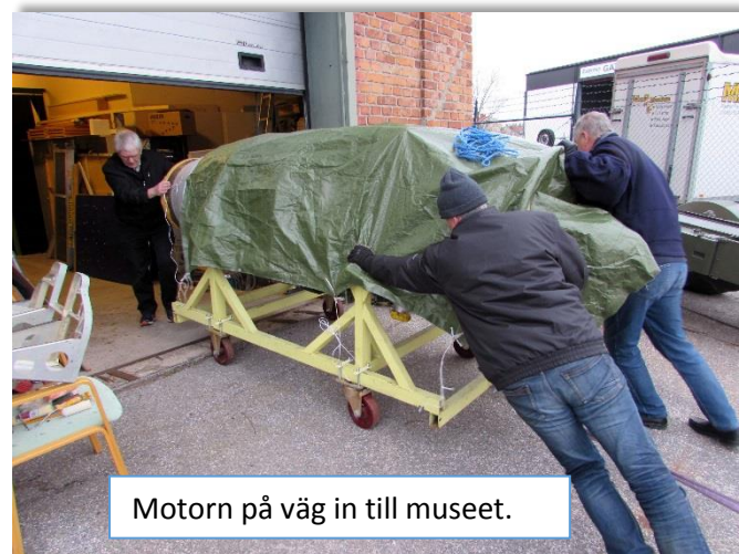
Motorn på väg in till museet.