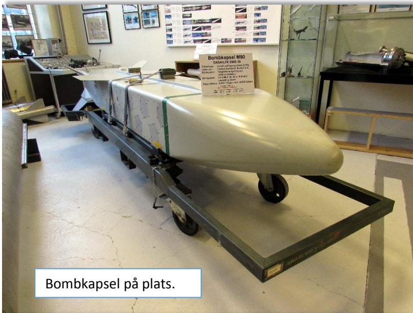
Bombkapsel på plats.