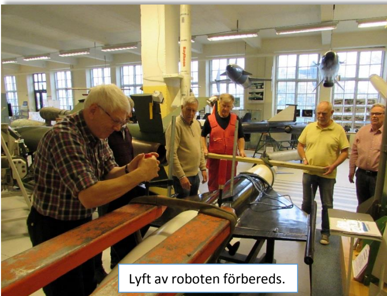
Lyft av roboten förbereds.