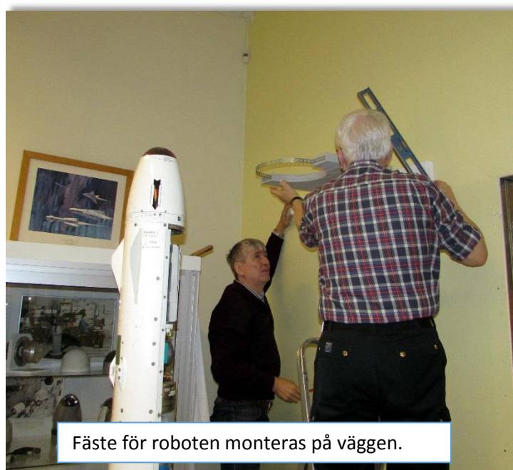
Fäste för roboten monteras på väggen.