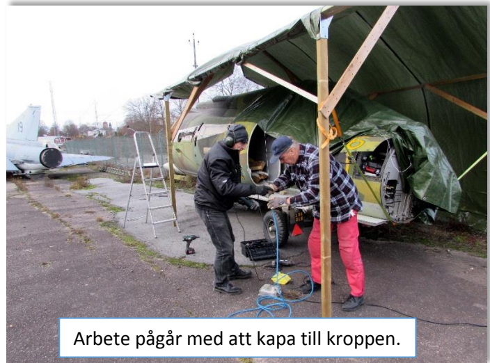
Arbete pågår med att kapa till kroppen.