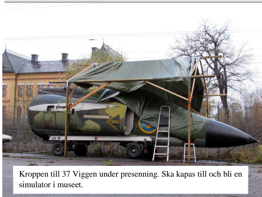
Kroppen till 37 Viggen under presenning. Ska kapas till och bli en simulator i museet.