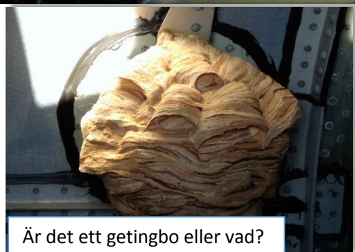
Är det ett getingbo eller vad?