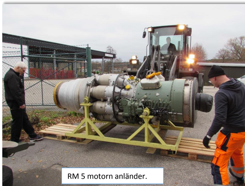
RM 5 motorn anländer.