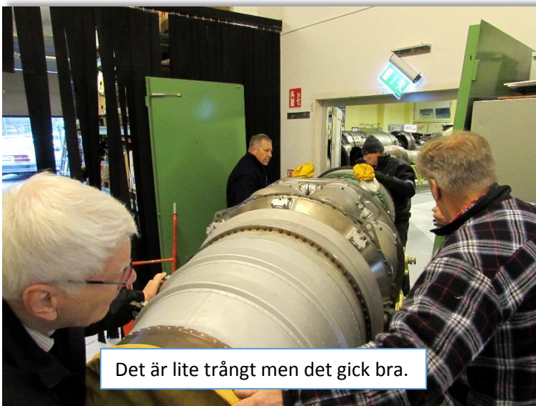
Det är lite trångt men det gick bra.